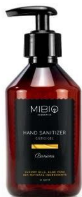
BANANA s ovocnou svěží vůní