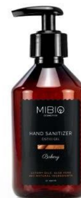
BAKERY s vůní skořice a hřebíčku