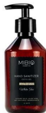
WHITE TEA s decentní vůní bílého čaje