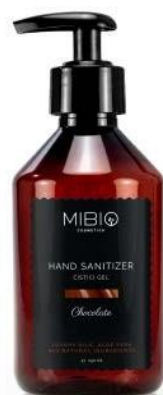
CHOCOLATE s jemnou vůní čokolády